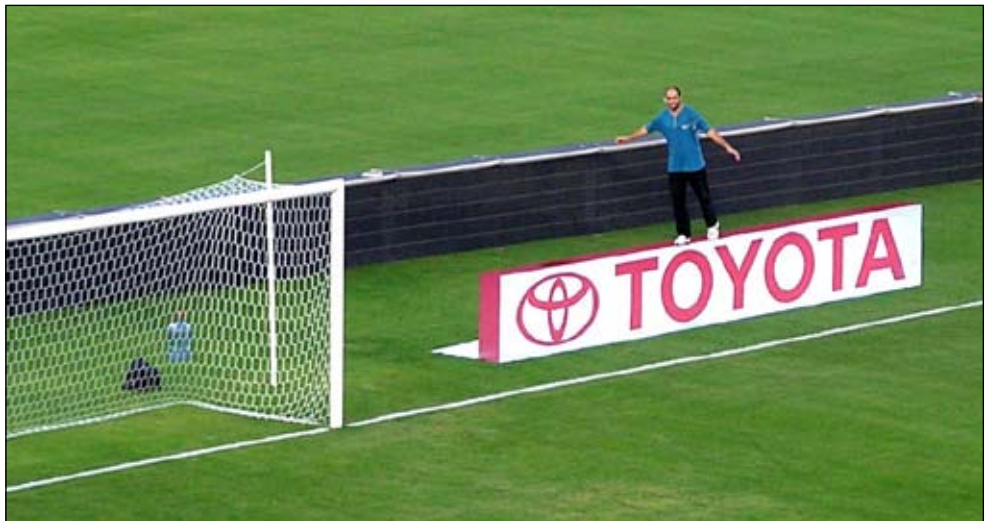
LogoPaint har patent på sine 3D-reklamer, der er blevet en eksportsucces. Firmaet har bl.a. den tyske Bundesliga som kunde.

ansatte har specialiseret sig i managerspil på nettet baseret på virkelige begivenheder og har oplevet en betragtelig betalingsvillighed for sine produkter: